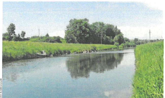
Der Weltwassertag soll auf die große Bedeutung sowie den Schutz des Wasser hinweisen.

Die Bäuerinnen und Bauern denken seit jeher in Generationen. Sie bewirtschaften ihr Land verantwortungsvoll. Die flächengebundene Landwirtschaft ist in Österreich gesetzlich verankert. Das heißt, den auf den Feldern wachsenden Kulturen dürfen nur so viele Nährstoffe zugeführt werden, wie sie zum Wachsen benötigen. „Wasser ist eine ganz wesentliche natürliche Ressource. Durch eine umweltschonende und nachhaltige Bewirtschaftung sichern die Bäuerinnen und Bauern die Spitzenqualität unseres Grund- und Trinkwassers. Die Teilnahme der landwirtschaftlichen Familienbetriebe am Agrarumweltprogramm ÖPUL trägt maßgeblich dazu bei“, erklärt Bauernbund-Direktor Wolfgang Wallner.