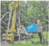
Wichtig für Wasserversorgung

Das Handwerk des Brunnenbauers zählt zu den ältesten Berufen überhaupt, auch heute ist der Handwerksberuf noch unentbehrlich. Darüber hinaus sind sie heute auch Experten für die Gewinnung kostenloser und CO 2 -neutraler Energie aus der Erde mittels Erdwärmesonden.